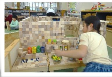
つみきでキッチンを作ったよ。 創造力がすごい!