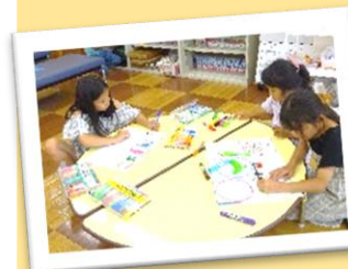
こども会議のポスターづくり