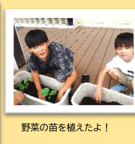
野菜の苗を植えたよ!