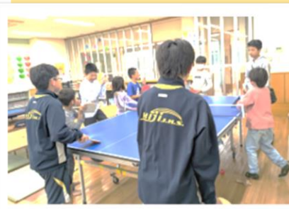
中学生もあそびにきていますよ。