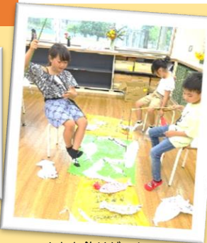
さかな釣りゲーム さかなも竿(さお)も手づくり!